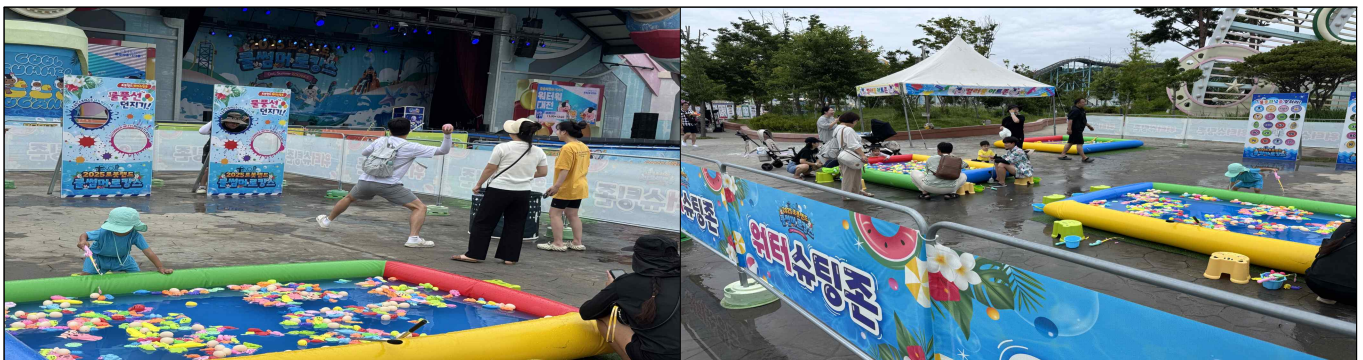
체험프로그램: 물총게임장 운영모습(2025)