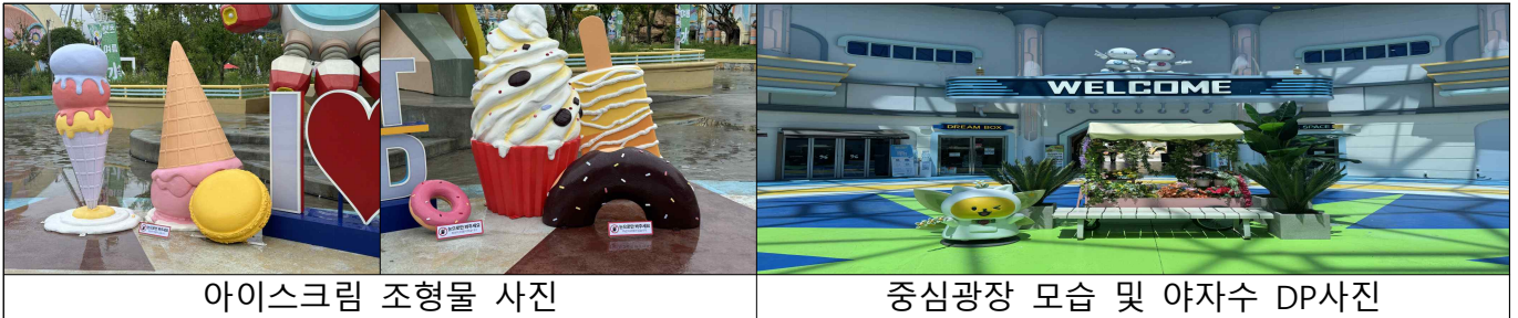
아이스크림 조형물 사진