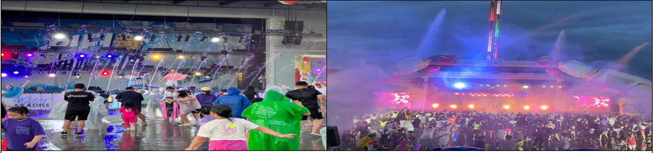
워터스플래시 프로그램 EDM 운영 모습(2025)