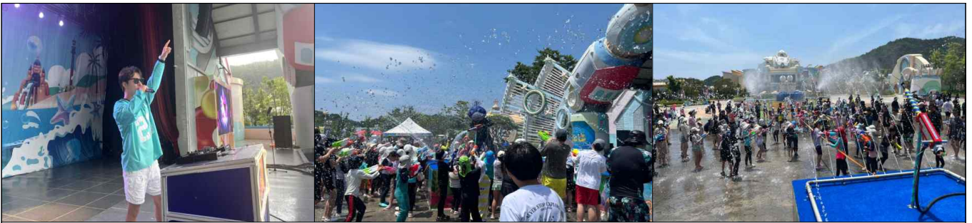
워터스플래시 프로그램 운영 모습(2025)